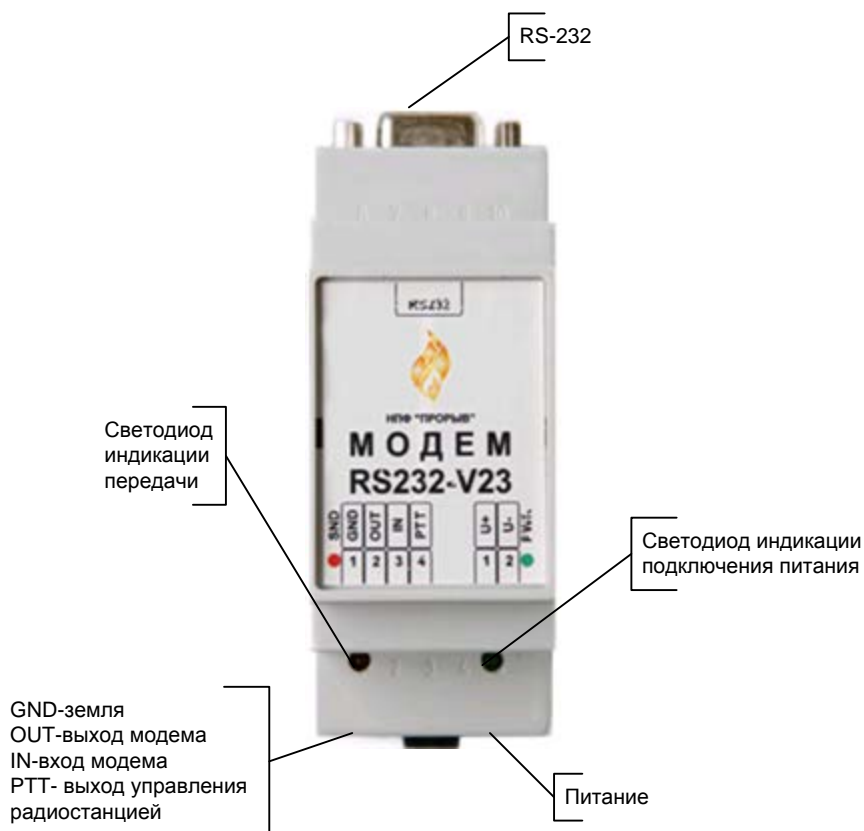
Рисунок 3 Вид панели аппаратного блока с элементами подключения и индикации

Вид панели аппаратного блока с элементами подключения и индикации см. Рисунок 3.