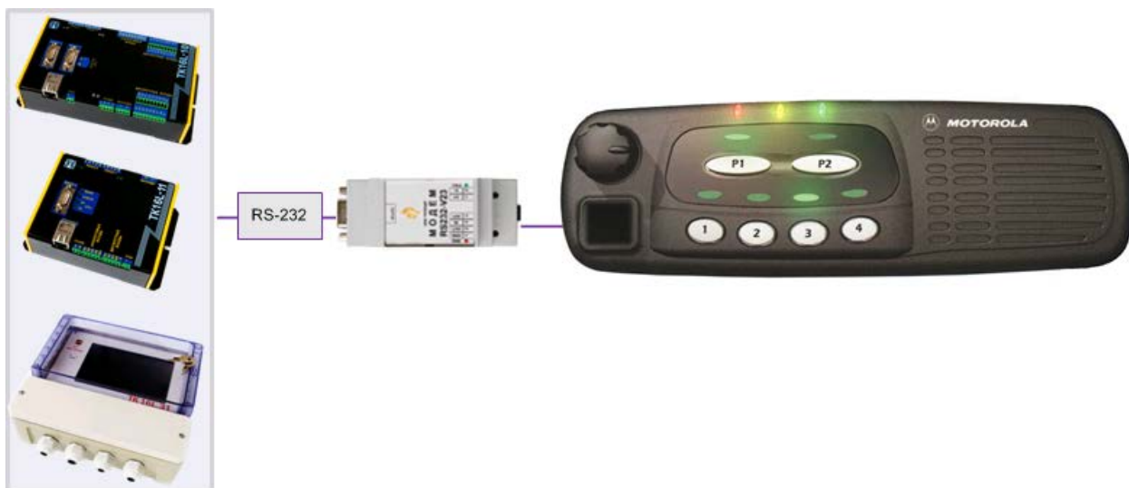
Рисунок 4 Подключение модема

Для согласования уровней входных/выходных сигналов модема на плате предусмотрены специальные переключатели – перемычки: JP1, JP2, JP3, JP4.