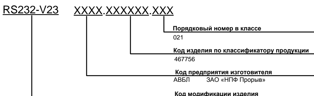
Рисунок 1 Структура кода изделия

Структура условного обозначения изделия см. Рисунок 1.