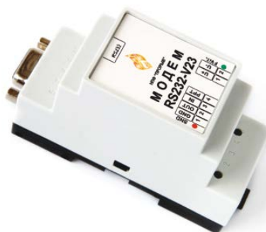
Рисунок 2 Общий вид аппаратного блока изделия

Вид панели аппаратного блока с элементами подключения и индикации см. Рисунок 3.